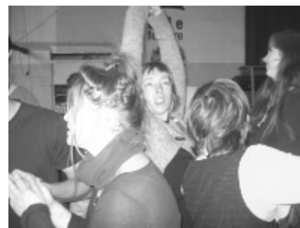
Le stage clown

Depuis la rentrée de Janvier, nous avons repris notre atelier "fétiche" de l'autre côté du miroir, à la Marelle. A la première séance nos amis, nous ont accueillis comme si on s'était quitté la veille ou tout au plus le lundi d'avant (alors que deux longs mois s'étaient écoulés). Ils étaient tous là, contents de nous voir et nous ont demandé comme à chaque fois: "qu'est qu'on fait aujourd'hui?" "On fait du théâtre?" Alors oui, zut à tout le reste et faisons du théâtre!